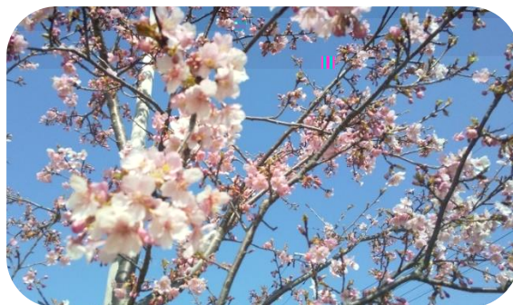
手賀沼沿いの河津桜