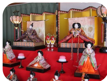
ロビーを飾った雛飾り

新木地区まちづくり協議会は、平成5年（1993年）4月に設立され、この4月で30年目を迎えます。我孫子市には10地区のまちづくり協議会があり、地域みなさんの親睦や交流を図り、コミュニティづくりを進めています。また近隣センターの管理運営も任されています。まち協の委員は、総務部、施設管理部、企画部、広報部の4部会のいずれかに所属して、毎月一回の部会やイベントなどに参加し、アイデアを持ち寄ったり、作業を分担したりと、一人ひとりの力を発揮しています。新木地域の住人やサークル・団体などに所属していれば、どなたでも自由に委員として参加できます。ボランティア活動ですので、仲間が沢山でき、楽しい時間も一杯。会社と違い、煩わしい人間関係とも無縁、あるいは家事からちょっと離れて楽しむのもOK。会社などに勤めていてもOK。地域にご自分の経験を還元したい方もOK。自治会などから、委員として指名され、引き続き活動している委員の方もいます。「地域に溶け込みたい、時間はたっぷりあるし」という動機で委員になった方も沢山います。男女を問いませんので、皆さんの参加をお待ちしています。なお、令和4年度の活動方針や役員などを決める定期総会は4月24日に開催されます。