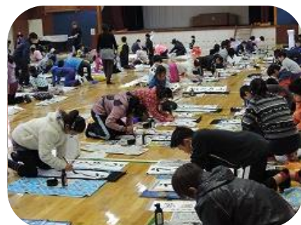
書初め大会の様子

今回、紹介させていただくのは、「書写」習字についてです。平成25年度に「書写書道」の研究発表をしていたことから、習字の盛んな学校と思われる方もいるかもしれません。実際、他校から新木小を訪れた先生は、「子どもたちの字が上手ですね」と言ってくださいます。そう言われると大変うれしくなるものですが、それよりも大きく感謝の念が湧いてきます。実はこの新木小の書写活動の根底を支えてくださっているのは地域のボランティアの方なのです。「書写」の授業には必ずボランティアの方が担任とチームを組み、指導者として参加していただいています。暑い日も寒い日も学校に通って来ていただいて子どもたちに作法や技術的なことについてご指導をいただいています。この紙面をお借りして新木小学校を紹介させていただいていますが、本当に大勢の地域の方のお力をお借りしていることがわかります。とてもありがたいことと思っています。