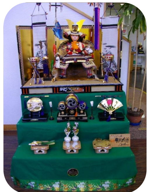
近隣センターのフリースペースを飾った五月人形