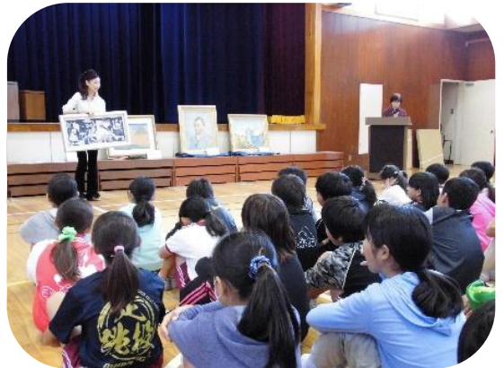
絵画のレプリカを用いた読み聞かせ

しかし、1年生から6年生まですべての学級で行うにはギリギリの人数になってきました。もしご協力していただける方がいらっしゃいましたら助かります。